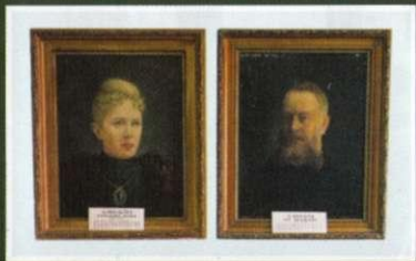
Фрагменти експозиції меморіальної кімнати П.І. Чайковського