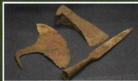
Знахідки козацької доби

Раніше невідомі і заборонені сторінки нашої історії розкриваються в залі визвольних змагань 1917-1922 років. Тоді на теренах нашого краю замайорів прапор Холодноярського повстання. В експозиції представлені документи і світлини учасників повстання, оригінальні зразки зброї того часу. Перед відвідувачами постають образи легендарних холодноярських ватажків – братів