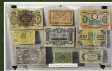
Фрагменти експозиції третього залу

Чучупаків, отаманів Хмари, Мамає, Завгороднього, Чорного Ворона, рядових козаків, селян, які поклали своє життя на вівтар Вітчизни.