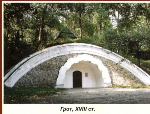
Грот, XVIII ст.

Пройдіться алеями старовинного кам'янського парку, закладеного в кінці XVIII ст. навколо поміщицького будинку. Присядьте на лавочці біля прекрасних витворів сучасного монументального