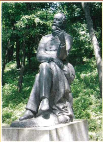
Пам'ятник П.І. Чайковському, 1975 р. Ск. М. Константинова, арх. В. Гнезділов

залишитись при цьому байдужою. Та й зустрине вас біля музею сам композитор, застиглий у бронзі в момент творчого натхнення.