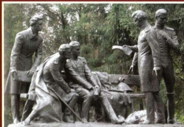
Пам'ятник декабристам, 1975 р. Ск. М. Вронський і В. Чепелик, арх. В. Гнезділов

Та все ж відомим в багатьох країнах це невелике містечко стало завдяки одному із найпопулярніших композиторів світу –