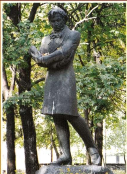
Пам'ятник О.С. Пушкіну, 1975 р. Ск. В. Шатух, арх. В. Гнезділов

Двічі, у 1820-1821 та 1822 рр., перебуваючи у Південному засланні, до Кам'янки приїжджав О.С. Пушкін, який був дуже зворушений тією