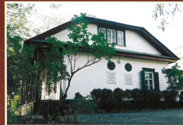
Літературно-меморіальний музей О.С. Пушкіна і П.І. Чайковського