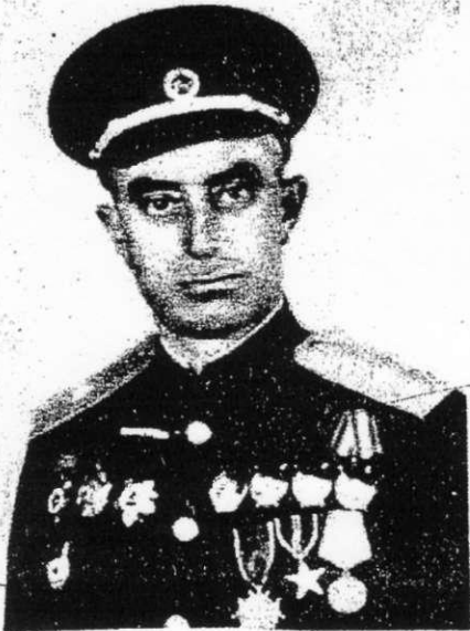
Кирило Кочович ДЖАХУА — генерал-майор, командир 69-ї гвардійської Червонопрапорної Звенигородської стрілкової дивізії.

В січні 1944 року радянські війська розпочали могутній наступ на південно-західному фронті. Тут Червона Армія завдала головного удару по противнику. Боротьба військ 1 і 2 українських фронтів під командуванням Ватутіна і Конєва за розширення і поглиблення плацдармів на правому березі Дніпра завершилась оточенням 10 гітлерівських дивізій і мотобригади в районі Корсунь-Шевченківська.