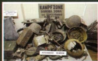
Фрагменти експозиції залу Другої світової війни