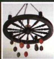
Фрагменти експозиції залу етнографії

У залі, присвяченому подіям Другої світової війни, представлені зразки зброї, військового спорядження радянських та німецьких солдатів, матеріали про партизанський і підпільний рух в краї, а також особисті речі, документи, нагороди наших земляків – учасників війни.